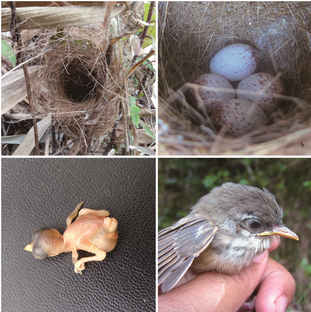
图 1 黑喉山鹪莺的巢 (a)、卵 (b) 和 1 日龄雏鸟 (c)、12 日龄雏鸟 (d)