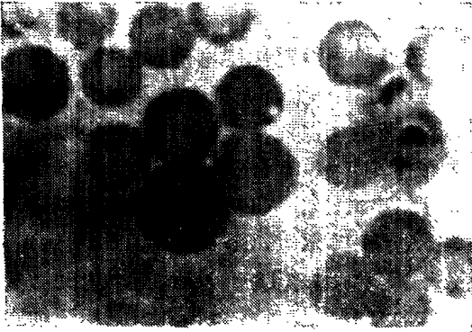
图1 Zy-IgG-E (Tr 细胞), ×750