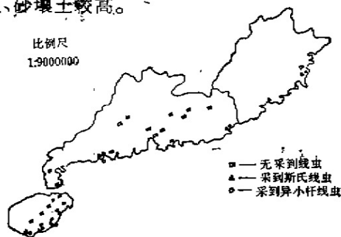
图1 斯氏线虫与异小杆线虫在海南、广东、福建的分布

琼海,万宁,陵水,三亚等地。其余县(市)目前仍未分离到。该两科线虫在闽、粤、海南的地理分布见图1,在不同作物地中的分布情况见表1,从图1和表1,我们初步认为,该两科线虫的发现率,沿海20公里内的花生地,番薯地较高,砂土、砂壤土较高。