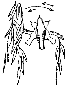
图2 黄眉柳莺摆体动态