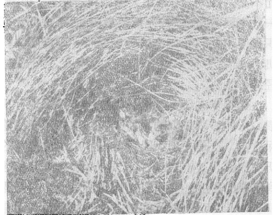
图 2 黑喉石鹇的幼雏

下旬为产卵期。在 5 月 25 日观察的一个巢内有卵 1 枚，26 日早 8 时 10 分、有卵 2 枚，27 日—30 日每日产卵一枚，大约日产 1 卵。7 个巢中只有一个巢内有 7 枚卵其余皆为 6 枚。卵的底色为鸭蛋青色，有棕褐色斑点，多集中于钝端。卵的平均大小为 17.7×13.9 毫米。