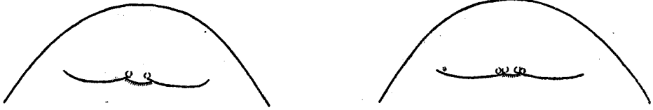
图1 秉氏蟾(左)和乳腺无齿蟾(右)幼生、口部闭合时,所示唇部各异之特征

I:3—3; 1枚为 I:4—5/I:5—5。乳腺无齿蟾的齿列色泽较浅,每个角质齿发育较上种略逊。其齿式如下:26枚为 I:4—4/I:4—4; 9枚为 I:3—3/I:4—4; 1枚为 I:3