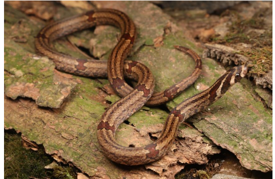
图 1 四川泸州市合江县采集的龙胜小头蛇 (YBU 240279)

YBU 240279 为成年雌性个体 (图 1, 2), 主要形态特征为: (1) 体全长 488 mm, 头体长 433 mm, 尾长 55 mm; 头较小, 头部与颈部区分不明显, 头长 12.76 mm, 头高 5.42 mm, 头宽 9.75 mm; (2) 无鼻间鳞和颊鳞, 前额鳞和吻鳞相接; (3) 眶前鳞 1 枚, 眶后鳞 1 枚, 颞鳞 2+2 枚; 上唇鳞 5 (1-2-2) 枚, 第一枚最小, 下唇鳞 6 (2-2-2) 枚, 颌片 2 对, 前颌片长于后颌片; (4) 背鳞通体 15 行, 光滑无棱; (5) 腹鳞 167 枚, 肛鳞二分, 尾下鳞 32 对, 近肛数枚尾下鳞一侧有黑色片状斑纹; (6) 背部具有 4 条棕褐色纵纹, 头上具三个“Λ”形斑; (7) 颈部至尾部有 13 条暗红色横纹贯穿 4 条纵纹至腹面, 其腹面鳞片白色或黑色, 且白色腹鳞两侧散状分布有若干黑色方形斑纹; (8) 尾粗短, 尾末端呈尖刺状。经比对, 新采集的小头蛇形态特征与龙胜小头蛇模式标本基本一致 (黄祝坚等 1978, 赵尔宓 2006)。