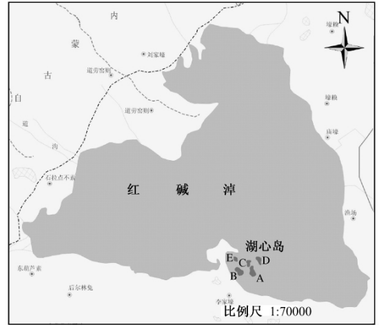
图1 研究地区示意图

研究地点位于红碱淖南部的湖心岛上(图1)2007年为5个岛A、B、C、D、E,但由于近年水位的变化,A、C岛已形成了一个大的湖心岛。红碱淖的湖心岛上的植被由于基质不同而有2种类型,一类是沙质类型的稀疏草本群落,主要植物有白沙蒿( Artemisia silversiana )、刺蓬( Salsola ruthenica )等,还见有长芒草( Stipa bungeana )、冰草( Agropyron cristatum )、芦苇( Phragmites communis )、阿尔泰狗哇花( Heteropappus altaicus )、碱茅( Puccinellia tenuiflora )等,A、C、B、E岛上植被均为沙质类型的稀疏草本群落,有普通燕鸥、鸥嘴噪鸥和遗鸥繁殖。另一类是基质为红砂页岩分化产物,目前基本处在裸地阶段,仅偶见有零星的寸草苔( Carex rigescens )和刺蓬的个体分布,仅D岛为此类型,仅有遗鸥在此营巢。