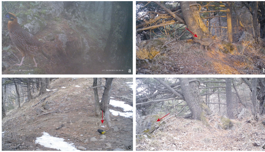
图 2 河南小秦岭国家级自然保护区新记录鸟类及其栖息环境