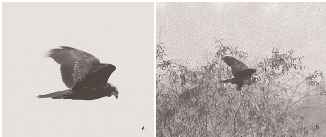
图 3 四川广汉记录到的白头鹞

四川已知分布有白腹鹞（ C. spilonotus ）、白尾鹞（ C. cyaneus ）和鹊鹞（ C. melanoleucos ）（李桂垣 1995，张俊范 1997，梁敏仪等 2016）。其中，白尾鹞和鹊鹞头部没有如白腹鹞或白头鹞般醒目的近白色区域；白腹鹞幼鸟初级和次级飞羽基部腹面比白头鹞幼鸟有着范围更大且更为明显的浅色区域；即便某些白腹鹞个体头部呈浅色，其范围较之白头鹞往往会更大，同时缺乏明显的深色“眼罩”（Ferguson-Lees et al. 2005, Duivendijk 2011,