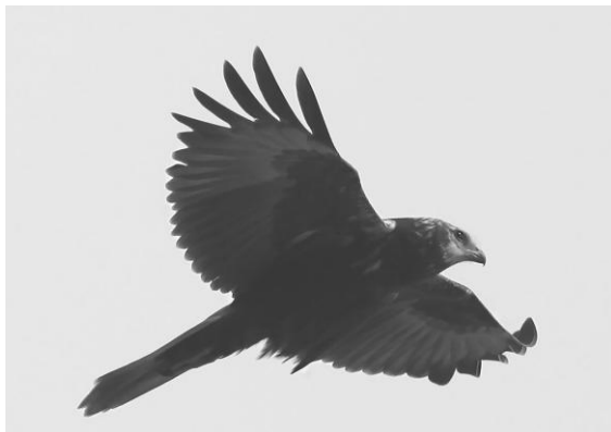
图 1 白腹鹞幼鸟

“√” means authors regard the Western Marsh Harrier or Eastern Marsh Harrier is a valid species; “—” means no information refer to the Eastern Marsh Harrier or lumped it into the Western Marsh Harrier as subspecies in corresponding reference.