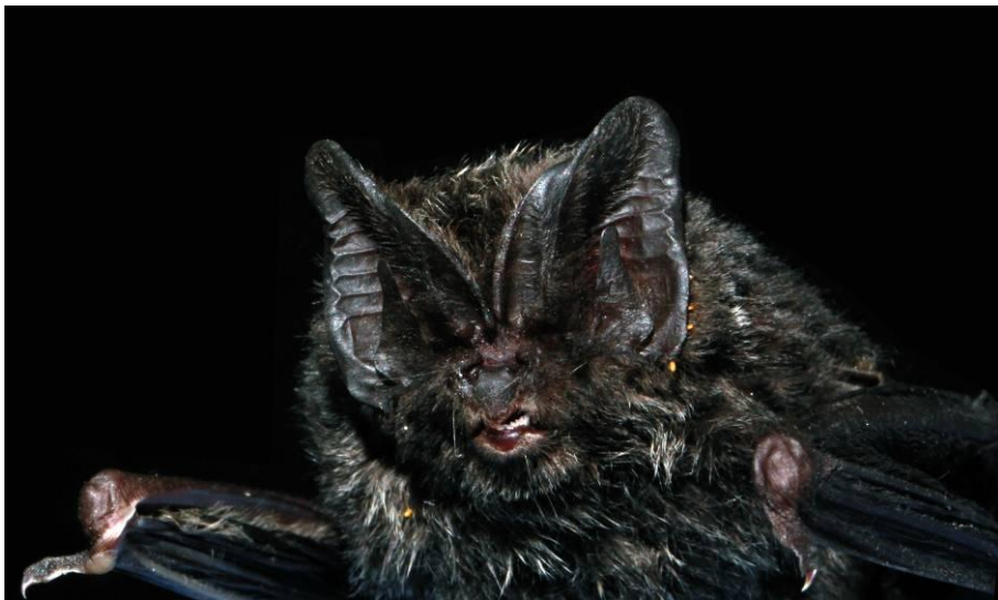
图 1 亚洲宽耳蝠照片