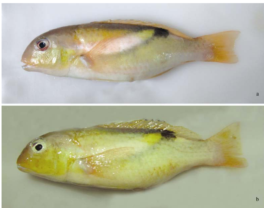
图 2 腰纹猪齿鱼