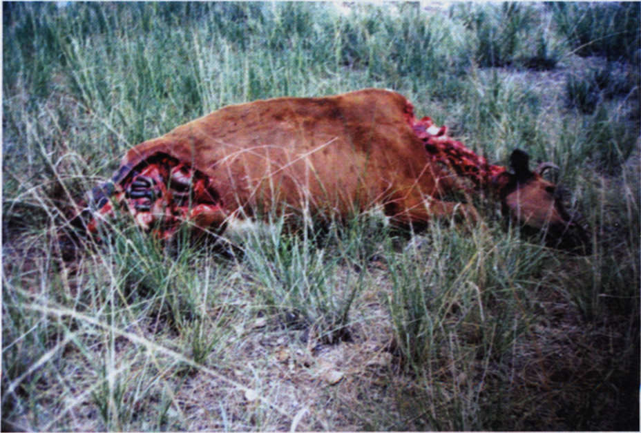
图 2 被狼捕杀牛的残骸