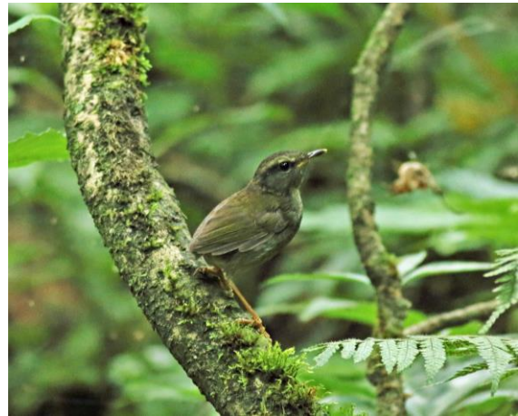
图 1 灰腹地莺

拍摄到其中 1 只的照片(图 1)，并录制了鸣叫的音频文件。同年 8 月 24 日，在接壤的马边县永红乡金河流域捏史觉附近(28°30'13.21"N, 103°21'7.65"E)海拔 1 460 m 次生阔叶林中又两次目击单只活动的灰腹地莺实体。