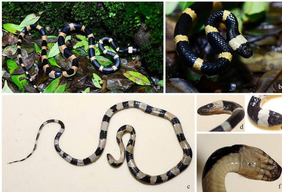
图 1 刘氏链蛇